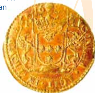
Koperen penning met het wapenschild van de familie van der Noot, 1681.